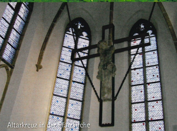
Altarkreuz in St. Katharinen