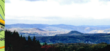
Ausblick in die Eifel