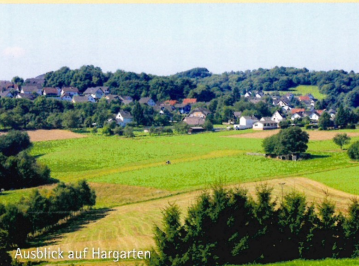
Ausblick auf Hargarten