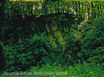
Basaltsäulen am Notscheider Weiher